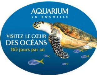
Mobile à suspendre deux faces