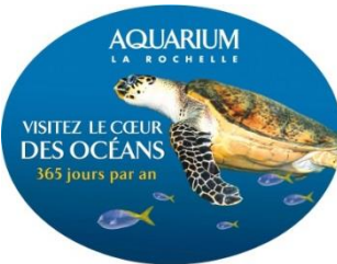
Mobile à suspendre deux faces