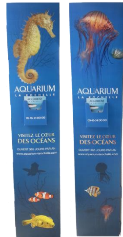
Totem porte-dépliants 3 faces (à monter)