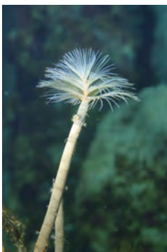
Spirographe, Spirographis sp.