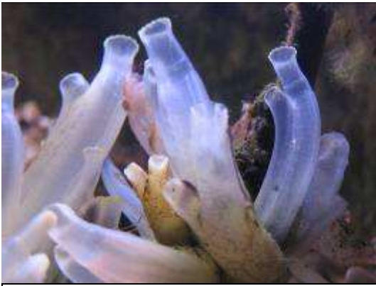
Ascidie jaune, Ciona intestinalis