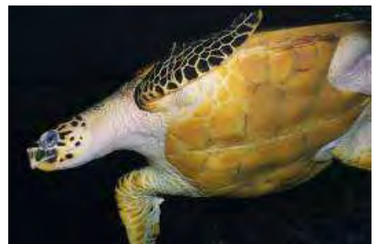
Tortue imbriquée, Eretmochelys imbricata