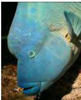
Napoléon, Cheilinus undulatus