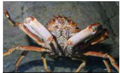
Araignée de mer, Maia squinado