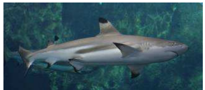
Requin pointe noire, Carcharhinus melanopterus