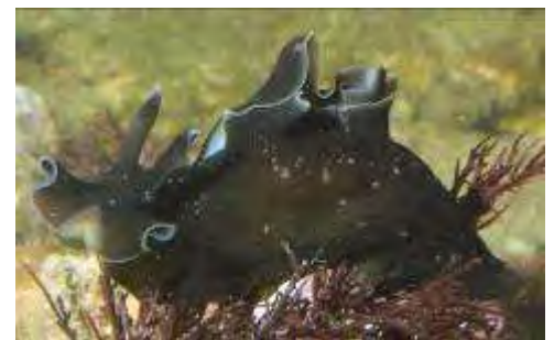
Aplysie ou lièvre de mer, Aplysia punctata

Mollusques gastéropodes : du grec gaster : estomac et podos : pieds, littéralement « pied sur le ventre ». Il s'agit du plus grand groupe des mollusques puisqu'il compte plus de 60 000 espèces. Les gastéropodes occupent à la fois le milieu terrestre, l'eau douce et le milieu marin (bigorneau, patelle, buccin, porcelaine...). Leur tête porte une ou deux paires de tentacules . La coquille, quand elle existe, est d'une seule pièce plus ou moins spiralée. Certains l'ont quasiment perdue durant leur évolution (limace de mer, aplysie). Ils possèdent une radula : sorte de langue cornée avec des dents minuscules, destinée à racler les algues sur les rochers.