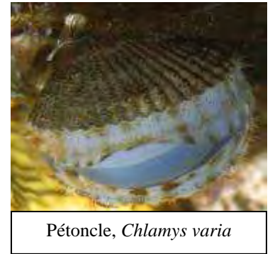
Pétoncle, Chlamys varia

Mollusques bivalves : leur coquille se divise en deux valves reliées par une charnière. Les branchies des bivalves jouent un rôle dans la respiration mais aussi dans l'alimentation. Elles captent le plancton végétal grâce au mucus qui les tapissent et le transportent jusqu'à leur bouche. Plutôt sédentaires, quelques individus peuvent s'enfouir dans le sable (praire, coque) et d'autres se fixer sur les rochers (moule, pétoncle) grâce à la sécrétion d'un ensemble de filaments (ou byssus) qui durcissent au contact de l'eau. Certains peuvent même se déplacer en fermant brusquement leurs deux valves (coquille St Jacques).