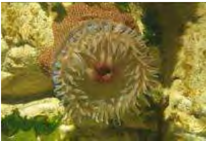
Anémone fraise, Actinia fragacea