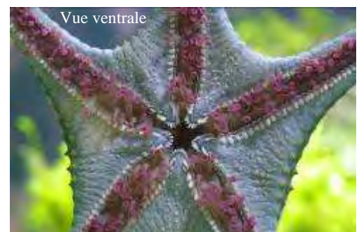
Etoile à boutons, Pentaceraster sp.

du grec ekhinos : hérisson et derma : peau, littéralement « peau de hérisson ». Les échinodermes regroupent exclusivement des animaux marins comme les oursins, étoiles, holothuries et concombres de mer... Leur squelette interne est formé de plaques calcaires. Ils possèdent des pieds ambulacraires, sorte de tentacules terminés par une ventouse qui leur permettent de se déplacer et de se fixer sur les rochers dans les zones agitées.