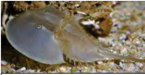
Limule, Limulus polyphemus