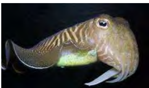
Seiche, Sepia officinalis

Mollusques céphalopodes : du grec kephalê : tête et podos : pieds, littéralement « pied sur la tête ».