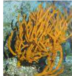
Eponge ramifiée Axinella polypoides