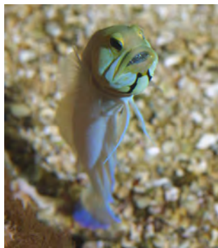
Opistognathe incubant les œufs dans sa bouche