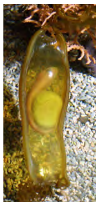
Œuf de roussette