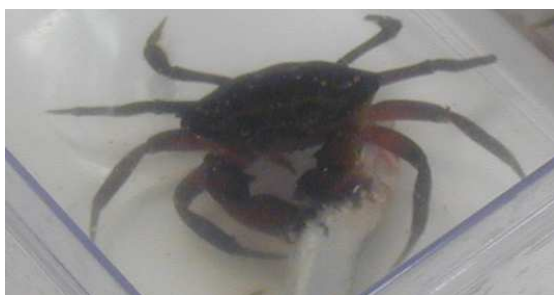
Crabe vert dépeçant un poisson mort.

- Les détritivores : ils consomment les déchets organiques c'est-à-dire les restes d'organismes appartenant à tous les niveaux trophiques qu'il s'agisse d'animaux ou de végétaux. C'est le cas de nombreux crustacés, vers et échinodermes.