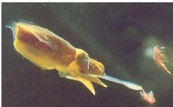
Seiche capturant du zooplancton grâce à ses deux tentacules protractiles.

- Les prédateurs : ils ont un comportement de chasseur (chasse à l'affût comme les rascasses ou poursuite). Ils sont en général dotés d'organes sensoriels performants afin de repérer leurs proies.