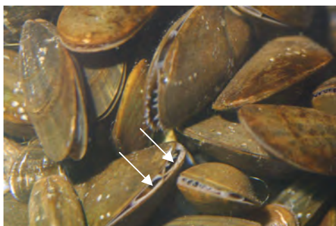
Moules filtrant l'eau par leurs siphons (→) afin d'en retenir les particules nutritives.