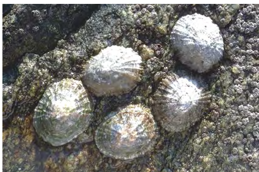
Patelles raclant la couverture algale.

- Les consommateurs d'algues : ils sont représentés par les brouteurs qui grignotent les algues charnues ou filamenteuses (exemple : poisson perroquet et poisson chirurgical) et les racleurs. Ces derniers raclent la fine pellicule algale soit grâce à des lèvres épaisses (exemple : mulot) soit grâce à une radula sorte de langue râpeuse que possèdent les gastéropodes (exemple patelle).