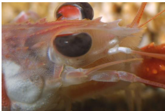
Œil composé de langoustine

Les crustacés eux, possèdent comme les insectes des yeux composés, ils leur permettent de détecter plus facilement les mouvements. Ils sont portés par un pédoncule mobile qui élargit leur champ de vision.