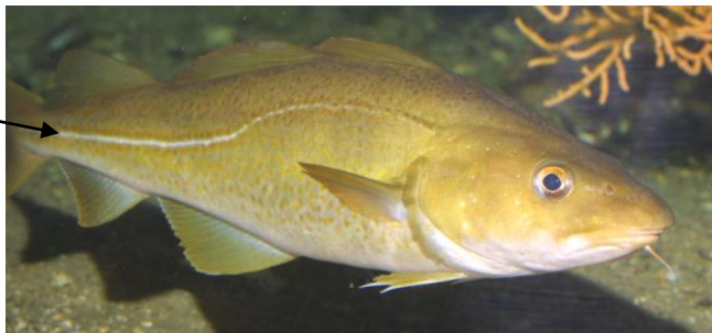
Ligne latérale de la morue

Les crustacés, eux, perçoivent les vibrations grâce à certains « poils » de leur corps. Chez la plupart des animaux, l'ouïe* et l'équilibre sont associés.