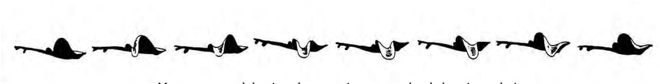
Mouvements ondulatoires des nageoires pectorales de la raie marbrée

* La propulsion par ondulation : une onde parcourt l'organe propulseur (corps ou nageoires). C'est le cas de la raie marbrée qui possède de larges nageoires pectorales semblables à des ailes.