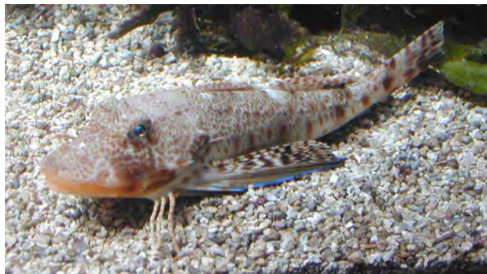
Grondin se déplaçant sur ses 3 rayons libres.

* La marche sur le fond : ce mode de déplacement se rencontre chez les crustacés (crevette, homard...), le crabe lui, se déplace de côté du fait de l'orientation de ses articulations. Certains poissons adoptent également ce procédé : les 3 rayons libres des nageoires pectorales des grondins se sont modifiés en sorte de pattes avec lesquelles ils marchent sur le sol pour y détecter leur nourriture.