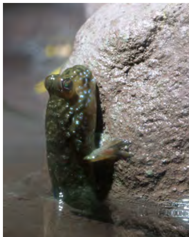
Périophtalme fixé sur un rocher grâce à une ventouse ventrale.

➤ Les périophtalmes dans le jardin tropical. Ces curieux gobies des mangroves sont capables de vivre provisoirement hors de l'eau. Leur respiration s'effectue par des échanges gazeux à travers la peau et certaines muqueuses riches en vaisseaux sanguins.