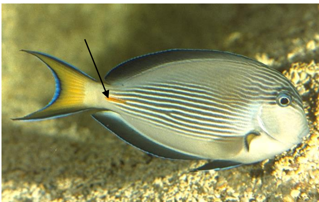
Un poisson chirurgien avec sa lame signalée par une tache orange

Certains animaux sont munis d'outils qu'ils utilisent activement pour se défendre en assommant (rostre du poisson scie), en piquant (épines dorsales du bar ou épines situées en bas des opercules des poissons ange) ou en coupant (scalpels des poissons chirurgien à la base de leur queue).