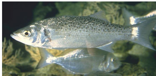
Le corps fuselé du bar lui permet une nage rapide.

Cette technique est utilisée par les animaux rapides qui ont ainsi une chance d'échapper à leurs prédateurs. Ils sont souvent caractérisés par un corps allongé et fuselé.