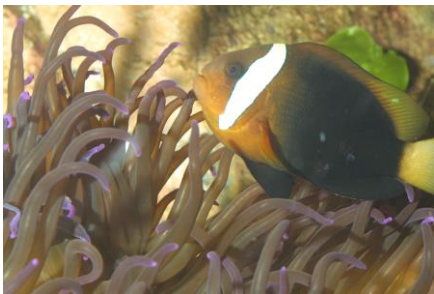
Symbiose entre un poisson clown et une anémone.

Des animaux qui n'appartiennent pas à la même espèce peuvent former des associations dites inter spécifiques. Ces relations peuvent être à bénéfice réciproque appelées symbioses*. C'est le cas du poisson clown qui trouve refuge dans les tentacules urticants de l'anémone sans être incommodé par son venin contrairement aux autres poissons. Pour cela, il s'enduit du propre mucus de l'anémone pour que celle-ci ne l'identifie pas comme un étranger. Le poisson clown, de son côté apporterait de la nourriture à son hôte et le débarrasserait de ses tissus morts.