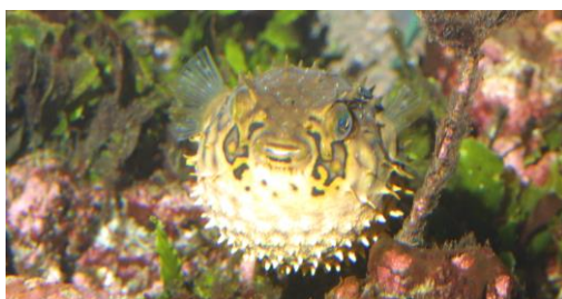
Le poisson porc-épic en posture d'intimidation (gonflement du corps)

Lorsqu'ils sont agressés, certains animaux tentent d'intimider leur adversaire. Ils peuvent pour cela, augmenter leur volume en absorbant une grande quantité d'eau dans une poche de leur estomac (poisson ballon et diodon) ou en dépliant leurs nageoires pectorales de grandes tailles (rascasse, grondin volant). Certains animaux adoptent des postures d'intimidation pour effrayer leurs adversaires (requin gris de récif). Enfin, des espèces peuvent émettre des sons lorsqu'ils se sentent agressés en frottant leurs dents situées au niveau de leur pharynx (poisson ange, grondin)