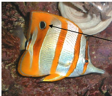
Le poisson papillon à bec et son faux œil ou ocelle

D'une manière générale, la livrée de camouflage consiste à passer inaperçu. Toutefois certains animaux utilisent la technique du "bluff". C'est le cas du poisson papillon à bec qui possède un ocelle à l'arrière du corps qui joue le rôle d'un faux œil et permet de détourner l'attention de l'ennemi.