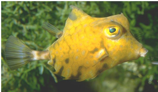
Le poisson coffre

Certains animaux sont munis d'une véritable cuirasse partielle ou complète qui protège leur corps : la coquille des mollusques (bivalves, gastéropodes...), la carapace des crustacés et des tortues, les piquants des oursins. Certains poissons possèdent eux aussi une véritable cuirasse. C'est le cas du poisson coffre ou de l'hippocampe dont le corps est recouvert de plaques osseuses.