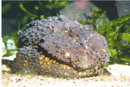
Le poisson pierre

Des animaux peuvent par leur forme se confondre avec un minéral ou un végétal : on parle d'homomorphie (ex. poisson pierre, poisson feuille...). D'autres se confondent avec leur milieu par leur coloration, on parle d'homochromie. Alors que certains portent une coloration fixe (ex. des raies), d'autres peuvent adapter leur coloration en fonction du milieu où ils se trouvent. C'est le cas des turbots et des soles.