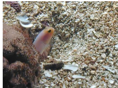
L'opistognathe se réfugie dans un terrier qu'il aménage sans cesse.

Les animaux trouvent différents refuges dans le milieu marin. Certains utilisent des abris naturels comme des grottes ou autres anfractuosités de rochers. C'est le cas du baliste à nageoires noires qui grâce à son épine dorsale peut s'ancrer. Il devient alors impossible de le déloger. D'autres peuvent s'enfouir sous le sable. Quelques espèces se fabriquent leur propre abri. Il peut s'agir d'un terrier ou, comme dans le cas du poisson perroquet, d'un cocon de mucus à l'intérieur duquel il se réfugie pour passer la nuit.