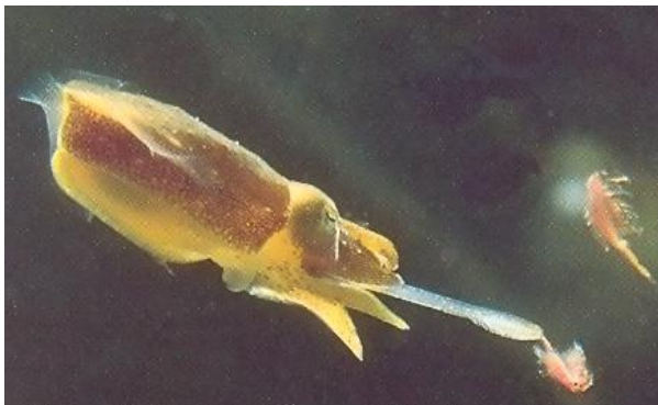
Seiche capturant du zooplancton grâce à ses deux tentacules protractiles.

- Les prédateurs : ils ont un comportement de chasseur (chasse à l'affût comme les rascasses ou poursuite). Ils sont en général dotés d'organes sensoriels performants afin de repérer leurs proies.