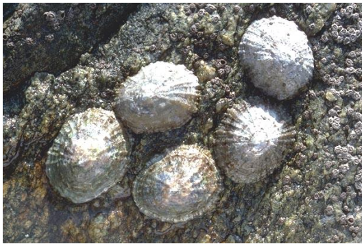
Patelles raclant la couverture algale.

- Les consommateurs d'algues : ils sont représentés par les brouteurs qui grignotent les algues charnues ou filamenteuses (exemple : poisson perroquet et poisson chirurgical) et les racleurs. Ces derniers raclent la fine pellicule algale soit grâce à des lèvres épaisses (exemple : mullet) soit grâce à une radula sorte de langue râpeuse que possèdent les gastéropodes (exemple patelle).