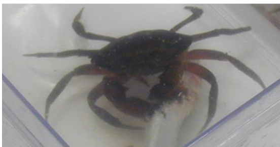
Crabe vert dépeçant un poisson mort.

- Les détritivores : ils consomment les déchets organiques c'est-à-dire les restes d'organismes appartenant à tous les niveaux trophiques qu'il s'agisse d'animaux ou de végétaux. C'est le cas de nombreux crustacés, vers et échinodermes.