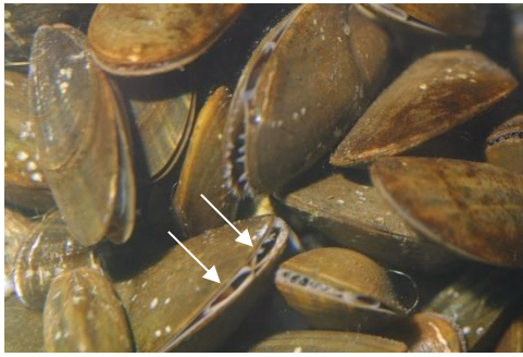
Moules filtrant l'eau par leurs siphons ( →) afin d'en retenir les particules nutritives.

- Les consommateurs d'algues : ils sont représentés par les brouteurs qui grignotent les algues charnues ou filamenteuses (exemple : poisson perroquet et poisson chirurgical) et les racleurs. Ces derniers raclent la fine pellicule algale soit grâce à des lèvres épaisses (exemple : mullet) soit grâce à une radula sorte de langue râpeuse que possèdent les gastéropodes (exemple patelle).