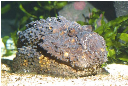
Le poisson pierre

Des animaux peuvent par leur forme se confondre avec un minéral ou un végétal : on parle d'homomorphie (ex. poisson pierre, poisson feuille...). D'autres se confondent avec leur milieu par leur coloration, on parle d'homochromie. Alors que certains portent une coloration fixe (ex. des raies), d'autres peuvent adapter leur coloration en fonction du milieu où ils se trouvent. C'est le cas des turbots et des soles.