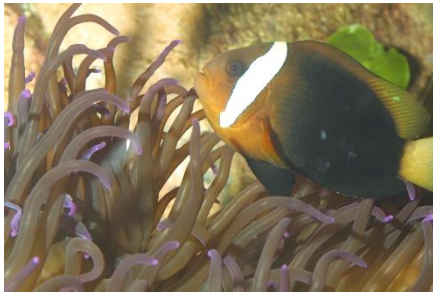
Symbiose entre un poisson clown et une anémone.

Par contre, le commensalisme ou carpose est une relation dont un seul intervenant y trouve un bénéfice sans pour autant porter préjudice à son hôte (exemple du poisson rasoir et de l'oursin).