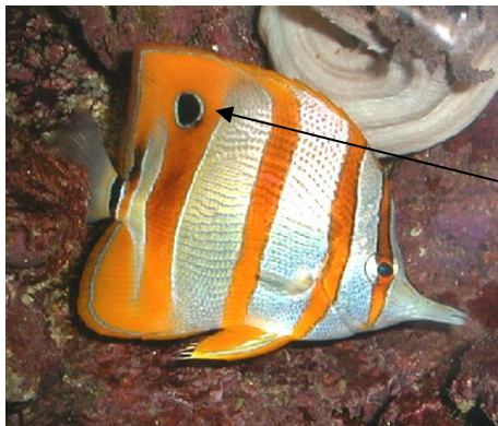
Le poisson papillon à bec et son faux œil ou ocelle

D'une manière générale, la livrée de camouflage consiste à passer inaperçu. Toutefois certains animaux utilisent la technique du "bluff". C'est le cas du poisson papillon à bec qui possède un ocelle à l'arrière du corps qui joue le rôle d'un faux œil et permet de détourner l'attention de l'ennemi.