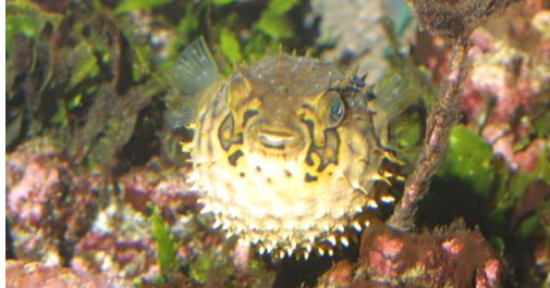
Le poisson porc-épic en posture d'intimidation (gonflement du corps)

Lorsqu'ils sont agressés, certains animaux tentent d'intimider leur adversaire. Ils peuvent pour cela, augmenter leur volume en absorbant une grande quantité d'eau dans une poche de leur estomac (poisson ballon et diodon) ou en dépliant leurs nageoires pectorales de grandes tailles (rascasse, grondin volant). Certains animaux adoptent des postures d'intimidation pour effrayer leurs adversaires (requin gris de récif). Enfin, des espèces peuvent émettre des sons lorsqu'ils se sentent agressés en frottant leurs dents situées au niveau de leur pharynx (poisson ange, grondin).