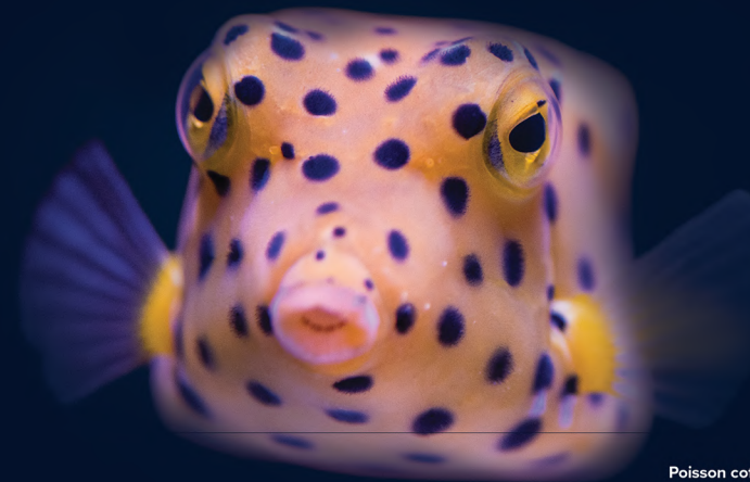
Poisson coffre Ostracion cubicum